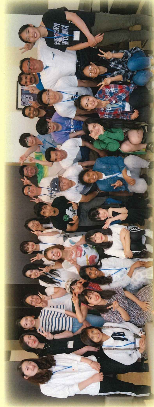
2019年度奨学生倉敷研修会にて(2018・2019年度財団奨学生)