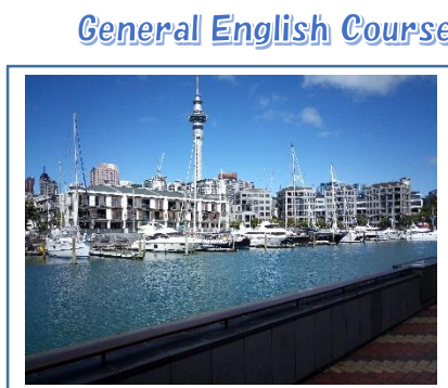
General English Course

【場所】 ニュージーランド オークランド 【日程】 ①2020年2月17日(月)~2月28日(金) 2週間 ②2020年3月2日(月)~3月27日(金) 4週間 ③2020年2月17日(月)~3月27日(金) 6週間 【費用】 ①NZ $ 1,832 (約 127,000円) ②NZ $ 3,154 (約 219,000円) ③NZ $ 4,476 (約 310,000円) (授業料(20%OFF)、登録料、ホームステイ費用、ホームステイ先での食費、空港片道出迎え費、テキストレンタル料を含む) 【内容】 英語研修 【滞在】 ホームステイ 【申請締切】 2019年11月29日(金) 17:00 ※各自で渡航前に NZeTA 申請