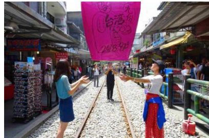
【ローカル鉄道平溪線の調査】