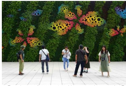
【文創地域の調査（松山文創園區）】