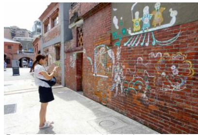
【文創地域の調査（剝皮寮歴史街区）】