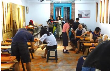
【文創地域の調査（URS127玩芸工場）】