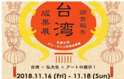
【台湾調査成果報告展：ギャラリーまんなか】